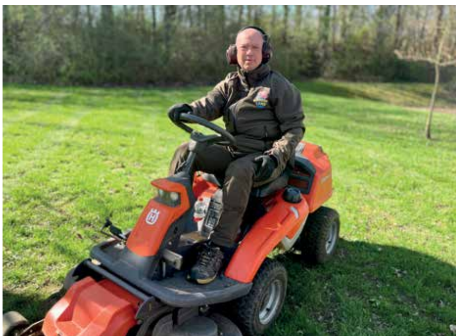
Der er mange kilometer græs at slå i den 130.000 m 2 store forlystelsespark.

"Jeg har et rigtig godt samarbejde med mine kolleger og vi planlægger selv vores arbejdsdag. Jeg kan godt lide, at vi har det så frit og ingen blander sig i, hvordan vi gør tingene. Det er rart at have en ledelse, der stoler på os."