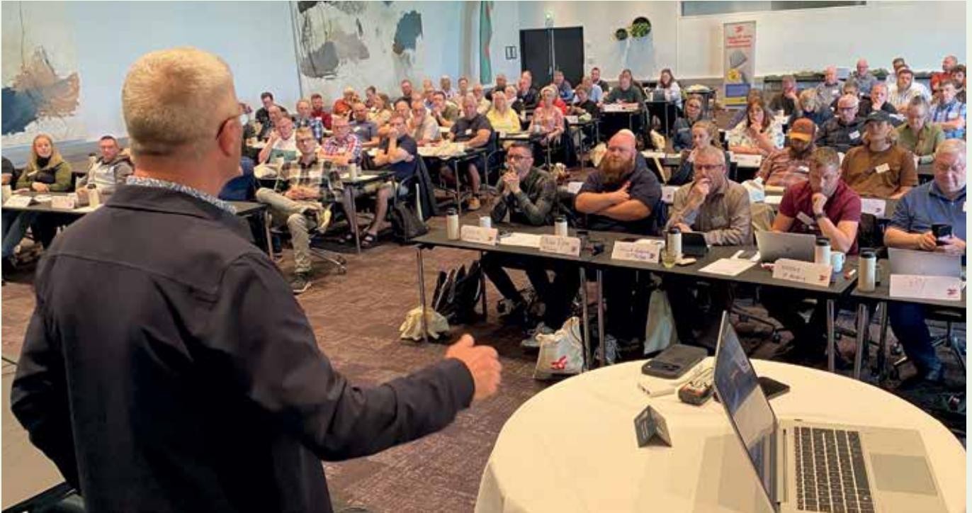
Fuldt hus. 114 deltagere var mødt frem til Grønne Dage i Kolding.